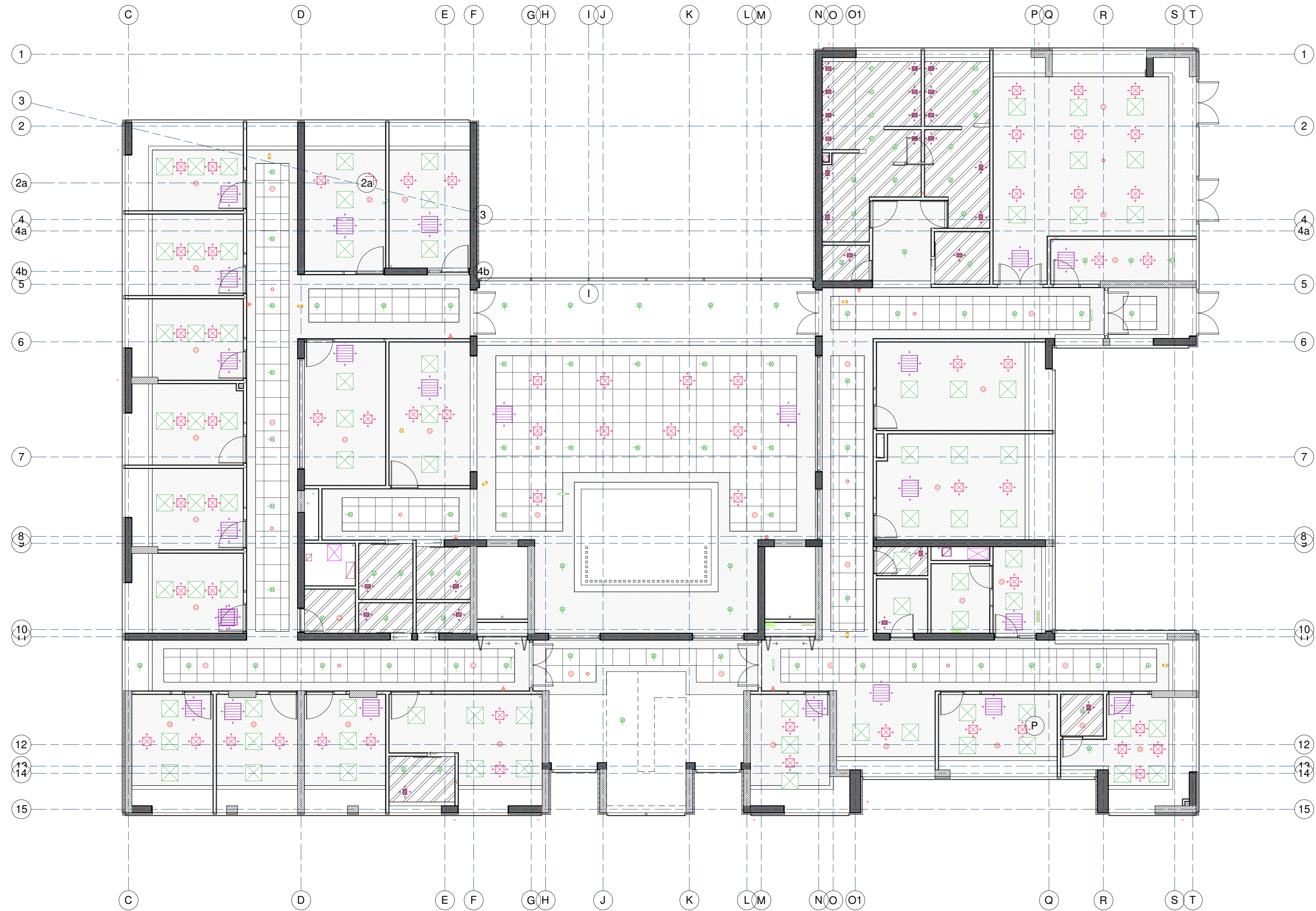
Planta Cielo Reflejado Piso 3 1 : 100